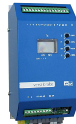
Bremsgeräte VB 230/400-40 ... 600