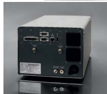
Dash-gastec-MAP Check 3-DE-3