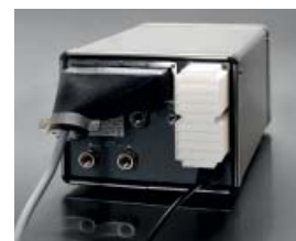
OBER: Abbildung mit optionalem IP45 Schutz-Set.

4: Sofern das MAP Check 3 mit der GasSave Funktion ausgerüstet, oder mit einem MAP Mix Provectus Gasmischer verbunden ist, regelt der Analysator die Gasmenge in Abhängigkeit vom gemessenen Restsauerstoffgehalt. Dies senkt den Gasverbrauch und vermeidet unzureichend begaste Verpackungen.